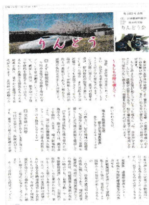
りんどう会誌 (隔月刊)