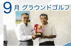
9月 グラウンドゴルフ