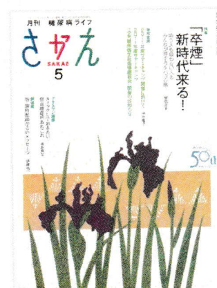
日本糖尿病協会機関誌 (月刊)

※ 入会希望の方は、申込書にご記入の上、年会費を添えて当院受付へお申し込みください。