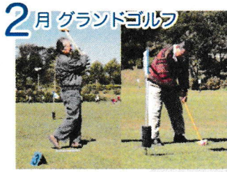
2月 グラウンドゴルフ