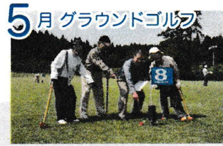
5月 グラウンドゴルフ